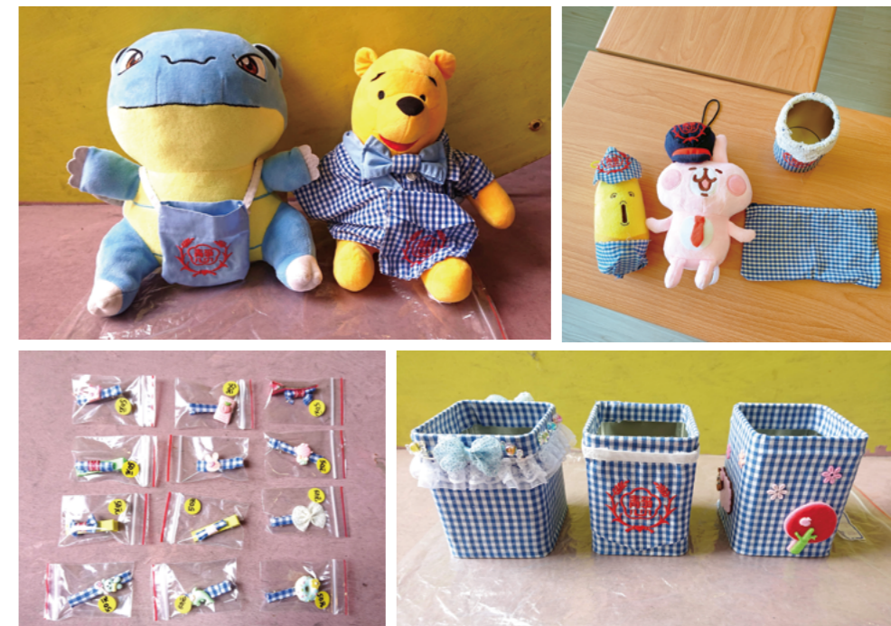
靜心國小利用舊制服製作成紀念品發起義賣活動

五個夢團隊的機會讓我們感到非常興奮。我們相信這將是一個實現夢想的絕佳機會，共同追尋我們的夢想。這段旅程充滿了無限的可能，我們將全力以赴，為夢想奮鬥！