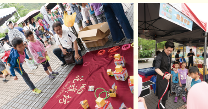
贊助廠商提供遊戲攤位與小朋友同樂 花旗坊(左) Eureka(右)

精彩的表演節目一個接著一個，隨著舞台上街舞的音樂結束，我們的健走活動也逐漸到了尾聲，很感謝社會大眾的支持與參與，明年還要再來喔！