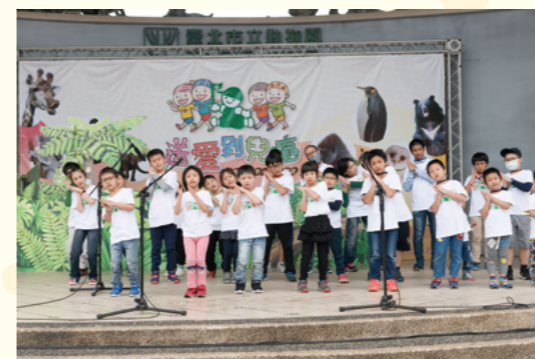
小麻雀合唱團快樂獻唱