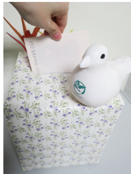
投入給自己未來的信件