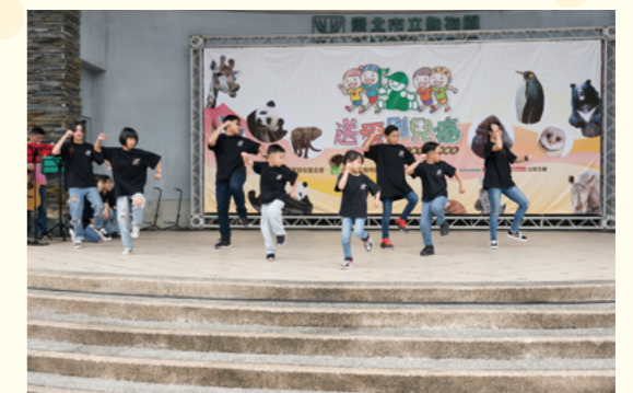
潮逸有限公司街舞表演