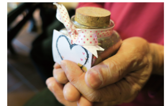
父親捧著星沙瓶的照片

不容易，在這四年當中，我們看到了你心情上的轉換，也指著父親捧著星沙瓶的照片告訴他，這是你第一年做的星沙瓶，父親輕輕地笑了，我想那是他發自內心的微