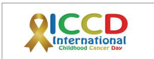
上圖為國際兒童癌症日的 Logo

國際兒童癌症日 (International Childhood Cancer Day) 始於西元 2002 年。這一年一度的活動是由兒童癌症國際組織 (Childhood Cancer International, CCI) 及 183 個組織機構 (來自全球 93 個國家) 共同創建。國際兒童癌症日是一個全球性的合作運動，其呼應每位癌症兒童不論其種族、貧富，都應得到最好的醫療照護，包括生理、心理、社會及靈性等各層面。藉由每年國際兒童癌症日的呼籲，增進社會大眾對於兒童癌症有更深入的瞭解與認識。