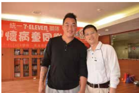
結合社會資源，鼓勵療程中的孩子及家長，勇敢面對癌症的治療

大家看到彼此的需要。並且持續不斷，這次孩子狀況沒法參加沒關係，還有下次機會，只要願意，永遠都有人會陪伴。