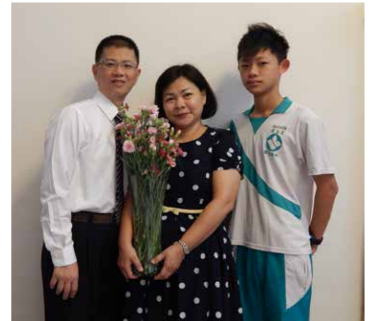
6 年來不間斷為抗癌小勇士付出的陳會長及其家人

沒學過主動付出，到了青春期的時候，他會遇到一樣用錢買不到的東西：感情，那時就整個人大崩盤了！他對孩子說：沒有甚麼是別人應該給你的。這樣的理念也用在病房的活動設計上。社會資源進來的禮物，比如五百先生的 Q 版畫，不直接發給小朋友，而是轉個彎請小朋友先把成品送給照顧他的醫護，然後再來領自己的。統一獅來院探訪病童，隔年再來，他就請敏智把去年的合照回饋給球員。所以就算是幼兒也可以學習給，雖然沒有明說，但是用行動來做。他在兒子小三的時候，就陪著踩小摺騎了四小時的路程到外婆家，兒子力氣幼嫩但志氣高尚，到達的時候全部等待的親人都為他慶賀歡呼，給了小孩最大的鼓勵和自信。此後每年更高難度的行路挑戰都能戮力達成，沒有甚麼可以難